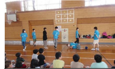
ジュニア・リーダーと遊ぼう