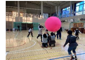
チャレンジキッズinへびた: キンボール