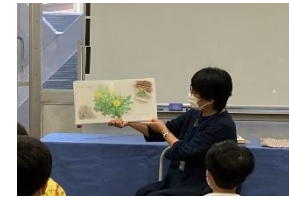
放課後子ども教室Bremen: お話し会