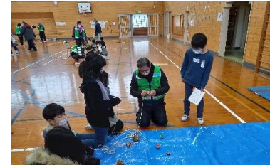
むかしあそび(こま回し)