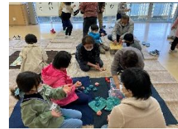
和小っ子クラブ: 昔の遊び(お手玉)

実施6回。MKSC2012が主体となって、学習支援やスポーツ活動、多様な体験活動を行った。