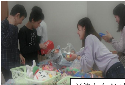
当法人イベントスタッフとして活動