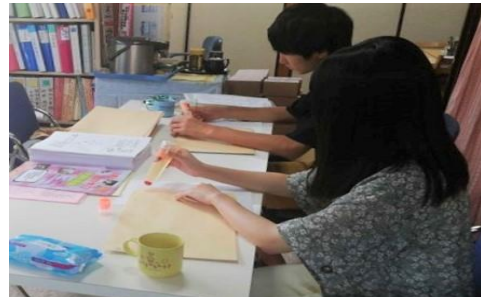
事務所にて広報紙発送準備作業 の手伝い