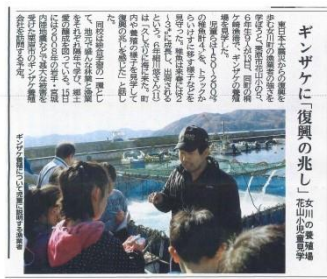
河北新報(11/14)に掲載されました