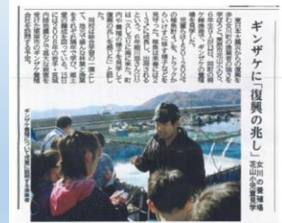
河北新報(11/14)に掲載されました