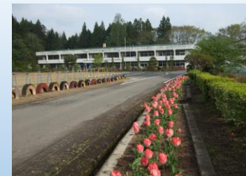
現在の花山小学校