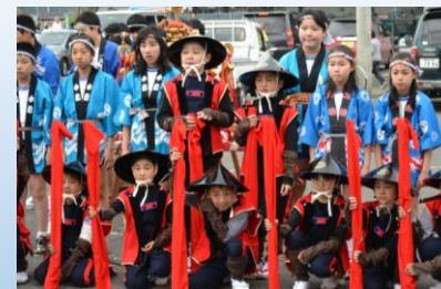
5月5日 鉄砲祭りに参加する子どもたち