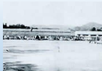
昭和32年頃の花山小学校