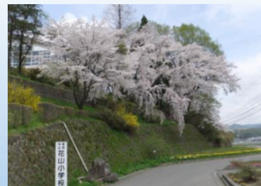
春の桜と花山小の看板