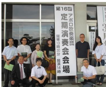
(見学会に参加した協議会会員)

「アポロ吹奏楽団」は、平成8年1月に地域の情報タウン誌「ジョイくりはら」での呼びかけにより集まったメンバーで結成された団体です。多くの方々に音楽を楽しんでもらうことを目的に活動を続けています。