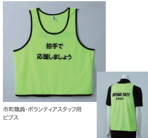
市町職員・ボランティアスタッフ用 ビブス