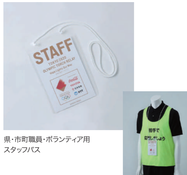
県・市町職員・ボランティア用 スタッフパス