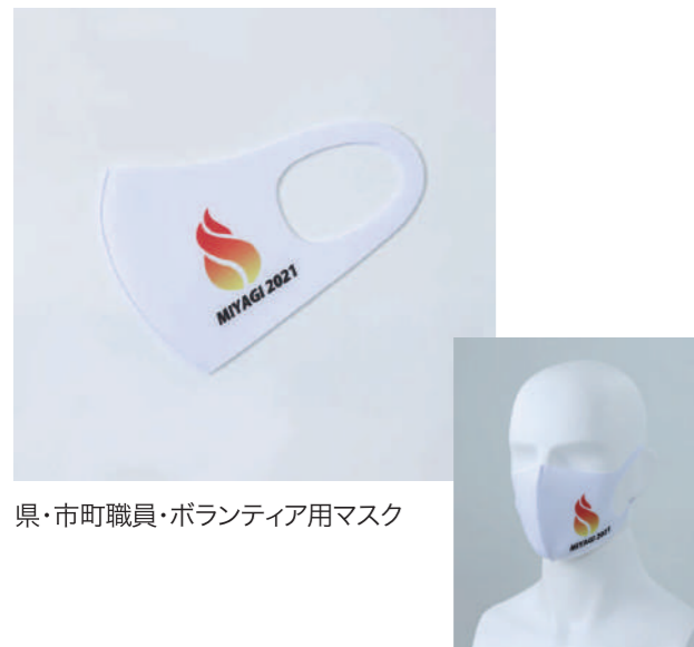
県・市町職員・ボランティア用マスク