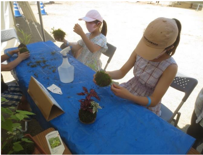
「宮城・栗原あれこれてんこ盛りフェア」 (仙台市青葉区/7月17日)、

林業振興部では、市内で生産された苔を用いた苔玉講習会を支援しておりますので、お気軽にお問い合わせください。