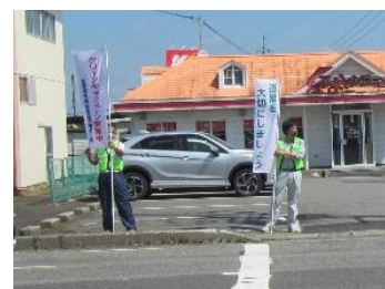
街頭活動 (国道398号伊豆野原交差点付近)