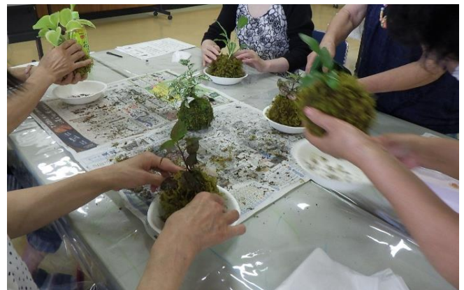
栗原市社会福祉協議会主催「技術養成ボランティアスクール」(栗原市/7月30日)