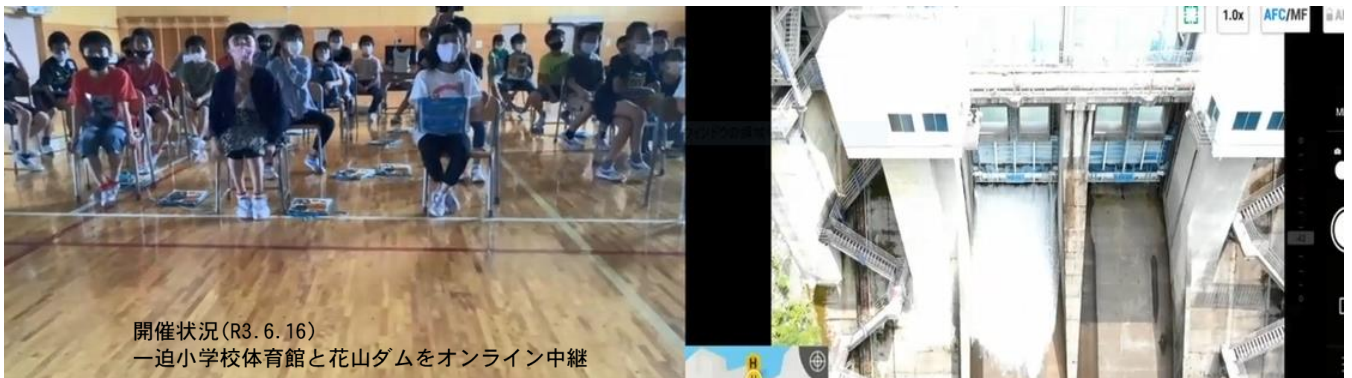
開催状況(R3.6.16) 一迫小学校体育館と花山ダムをオンライン中継

お問い合わせ：宮城県栗原地方ダム総合事務所 管理第一班 ☎0228-56-2233