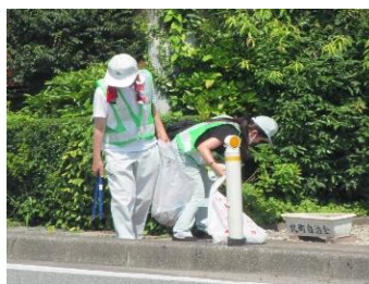
清掃活動 (国道398号築館薬師4丁目地内)

皆様も身近な道路に関心を持っていただくとともに、美しく安全に利用していただくようよろしくお願いします。