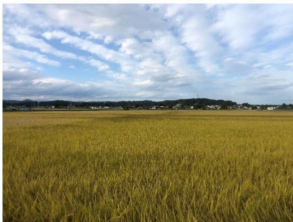
すくすくと稲が育ちました（稲屋敷・袋地区）