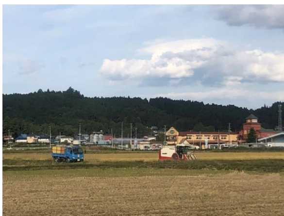
整備後の農地での収穫状況（稲屋敷・袋地区）