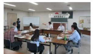
9/7に開催された選考委員会の様子

お問い合わせ：北部地方振興栗原地域事務所農業振興部 先進技術班 ☎0228-22-9437