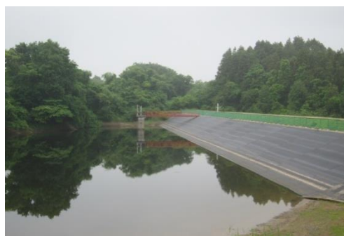
下手取2号堤ため池

東日本大震災から2年4ヶ月が経過し、当事務所管内のため池は復旧しましたが、沿岸部では今なお災害復旧工事を全力で実施しています。これからも災害復旧工事の早期完成に向けて、当部として可能な支援に取り組んでいきます。