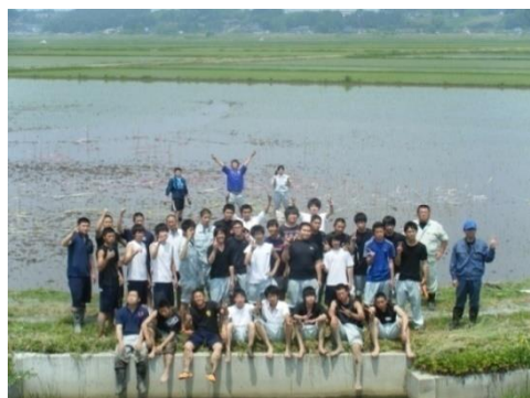
小牛田農林高等学校の皆さん

6年目となる今年は、宮城県観光PRキャラクターの「むすび丸」の図柄と、「エコ・せみね」の文字を田んぼに描きました。図案の作成や測量・マーキングは、事前に宮城県小牛田農林高等学校農業技術科2年生37名が行いました。田植えには地域住