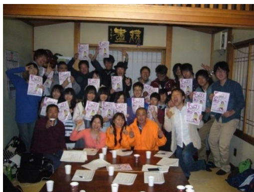
50名が活動する「ぐるっとゆるっと栗原」