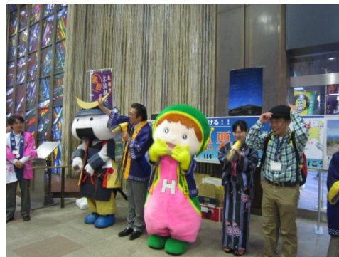
浴衣姿や登山スタイルで栗原の観光をPR

6月4日に、仙台駅コンコース内で、「仙台駅から22分で行ける栗原市」をキャッチフレーズに、栗原の見どころ、食べどころをPRしました。細倉マインパークのマスコット「マイン坊や」と宮城県観光PRキャラクター「むすび丸」も参加し、会場を盛り上げ、栗駒山のトレッキングや温泉、秘湯花山そばの里を大いにPRしてくれました。