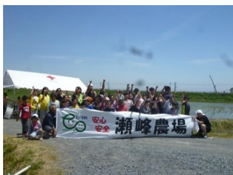
田植え後の集合写真