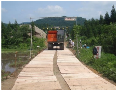
設置直後の試走の様子

今後、検討課題が解決されるとともに、被災した石巻の合板工場で製造される合板が、敷板として広く使用されることで、震災復興の促進に寄与することが期待されます。