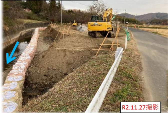
伊手川 95号 実施状況