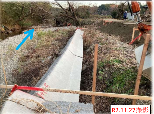
伊手川 97号 実施状況