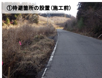
①待避箇所の設置(施工前)