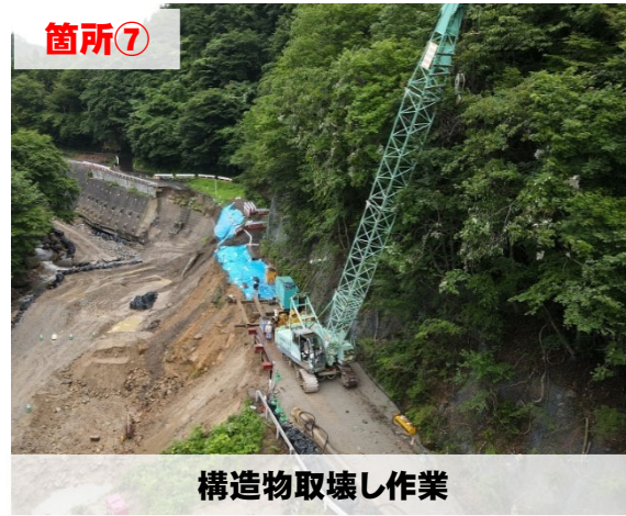
構造物取壊し作業