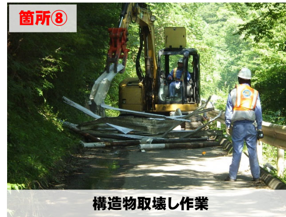
構造物取壊し作業