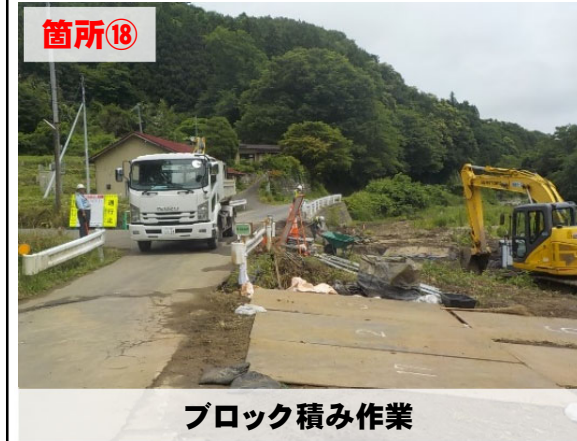
ブロック積み作業