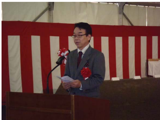
祝辞 宮城県議会 長谷川副議長 (議長代理)