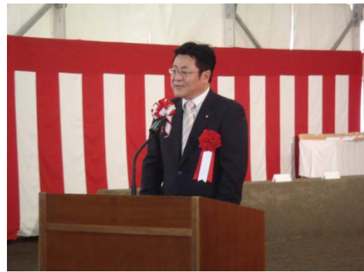
祝辞 西村衆議院議員