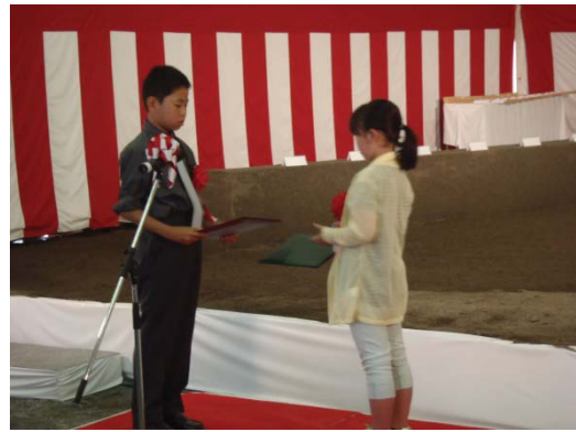
地元小学生による交流促進への思い (作文の交換)