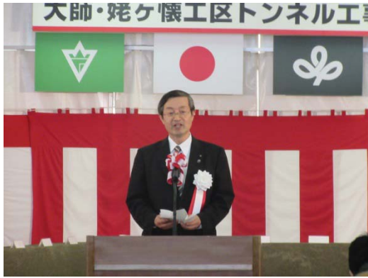
挨拶 宮城県 山田副知事