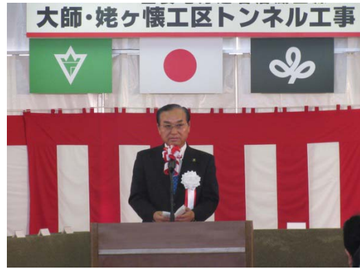
挨拶 岩沼市 菊地市長