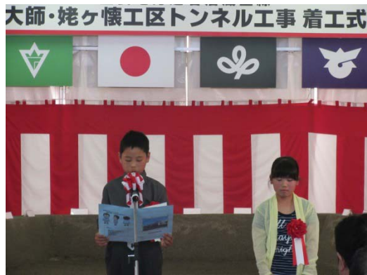
地元小学生による交流促進への思い (作文発表)