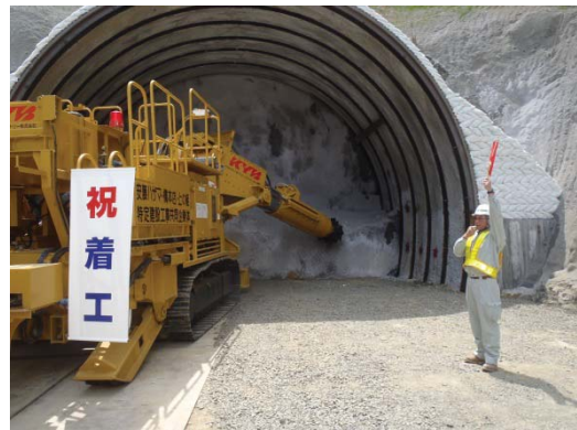
着工アトラクション (ロードヘッダによる掘削, 花火)