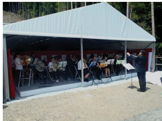
岩沼市吹奏楽団による演奏 (開式前, 閉式後)