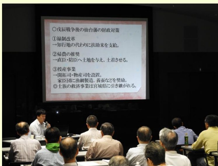
【みやぎ県民大学開放講座】