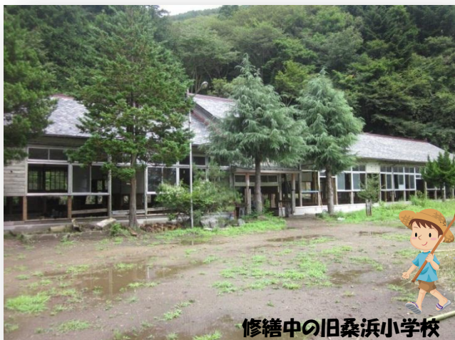
修繕中の旧桑浜小学校

なかでも「雄勝学校再生プロジェクト」は、石巻市雄勝町の2001年に廃校になった旧桑浜小学校の校舎を再生させ、国内外の子どもたちが命の大切さや自然との共生を学び、サステナブルな社会を担う人材を育成する自然学校とすることをめざしています。2015年のオープンに向けて、地元住民と立ち上げた協議会や全国のボランティアとともに手作りで校舎を修繕している真最中です。