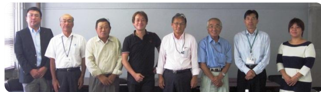
平成26年度石巻支部委員御出席の皆様