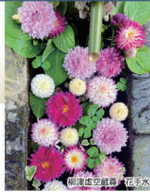
柳津虚空蔵尊 花手水