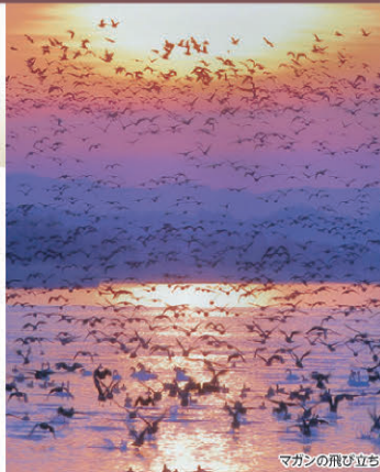
マガンの飛び立ち