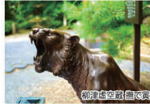
柳津虚空蔵尊蔵蔵