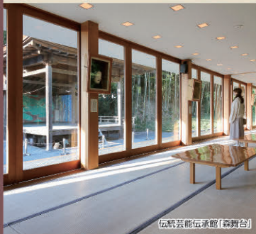
伝統芸能伝承館「森舞台」