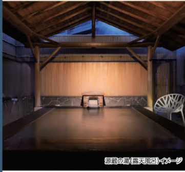
源泉の湯(露天風呂)イメーソ