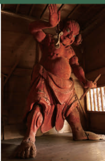
笑う仁王像