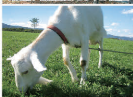
蔵王ハートランド