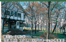
蔵王ハートランド