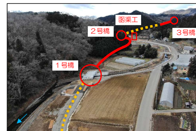
道路改良工事（1号橋～2号橋区間）