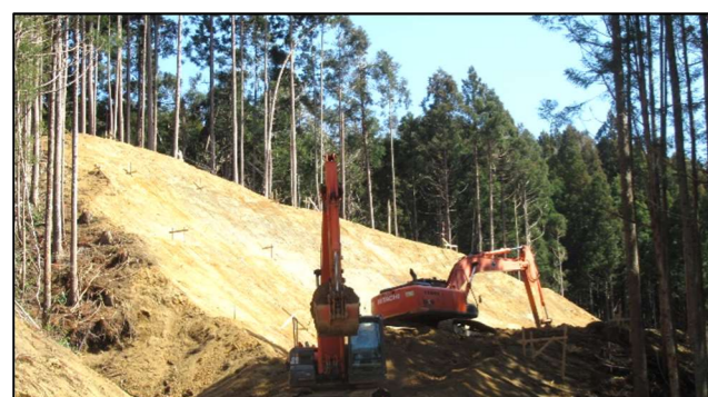
道路改良工事（7号橋～8号橋区間）