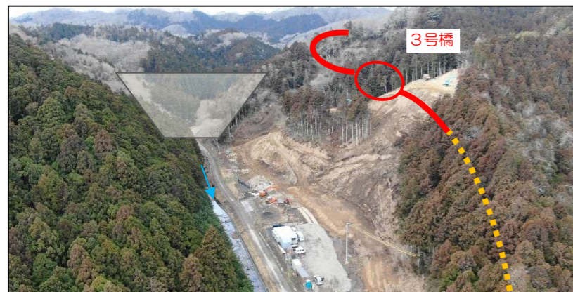
3号橋下部工・道路改良工事（2号橋～3号橋区間）