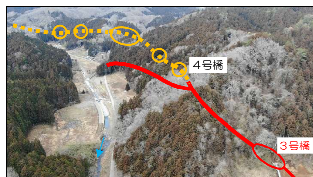
道路改良工事（3号橋～4号橋区間～現道）