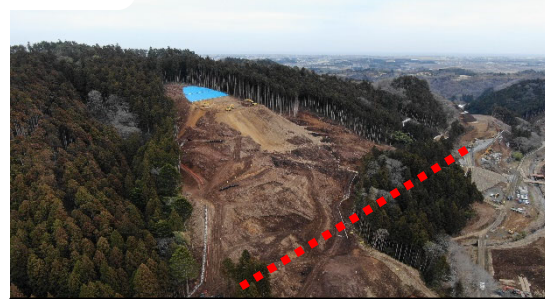
◎(R3)道路改良工事(その3)

(R3)農道橋下部工工事 (株)石井土木 R3.7.30~R4.6.30 【進捗率 46%】 ⑦