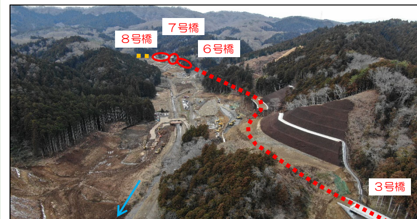
付替道路全景(ダム建設位置~8号橋)

(R3)道路改良工事(その2) グリーン企画建設(株) R3.10.8~R5.1.31 【進捗率 18%】 ⑧