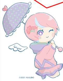
川内沢ダムイメージキャラクター「川内あい」

(R2)7号橋下部工工事 グリーン企画建設(株) R3.6.16~R4.3.31 【完成】 ④