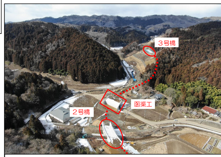
付替道路全景(2号橋~3号橋)

(R3)道路改良工事(その3) (株)深松組 R3.10.5~R5.3.24 【進捗率 17%】 ⑨