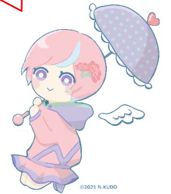
川内沢ダムイメージキャラクター「川内あい」