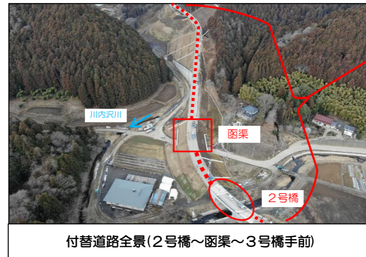
付替道路全景(2号橋~函渠~3号橋手前)