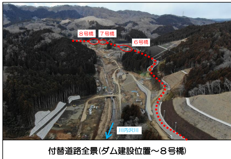
付替道路全景(ダム建設位置~8号橋)