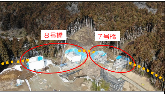
橋梁下部工工事（7号橋,8号橋）