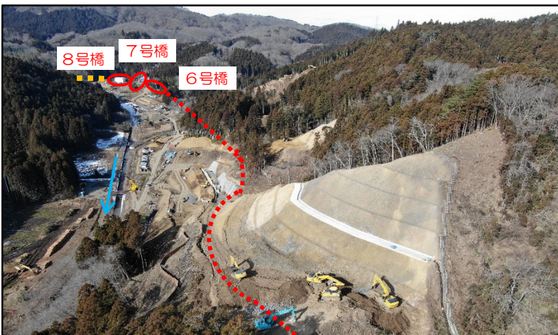
付替道路全景（ダム建設位置～8号橋）