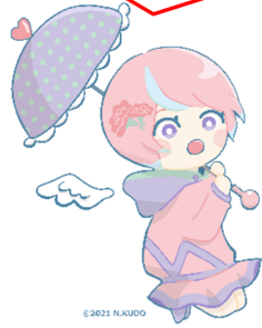
川内沢ダムイメージキャラクター「川内あい」