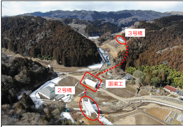
付替道路全景（2号橋～3号橋）