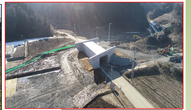
【②函渠工工事の完成!】