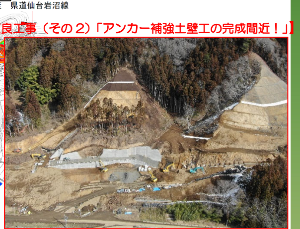
【①R2道路改良工事(その2)「アンカー補強土壁工の完成間近!」】