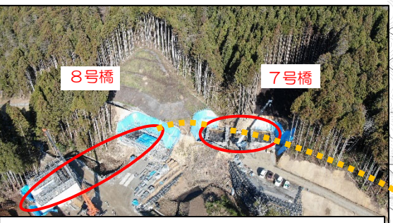
橋梁下部工工事(7号橋,8号橋)