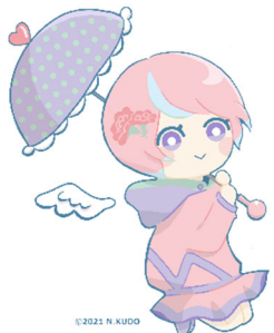
川内沢ダムイメージキャラクター「川内あい」