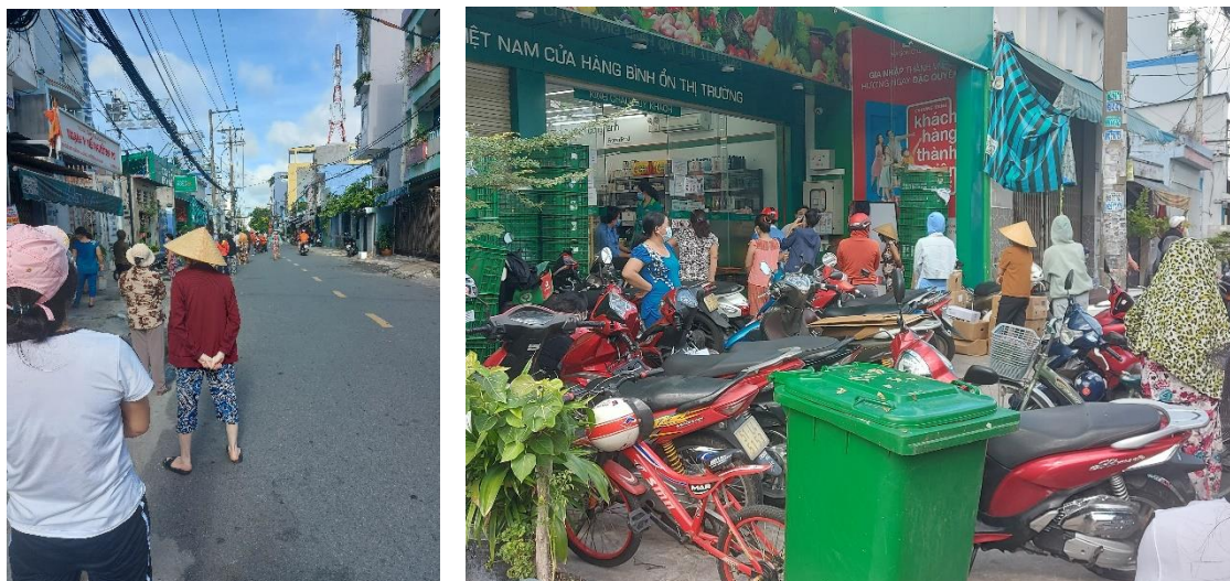
街中を走るのはデリバリー(食材)のみ(2021年8月3日撮影)

Shopee(食材配達)、Tiki(食材配達)、Cooky(食材配達)、AhaMove(運送・配送)などのアプリを通じて、食材を購入し最短2時間以内で配達されている。車は倉庫からスーパーやコンビニなどへのデリバリー、バイクは各宅へのデリバリーを行っているが、配達員も感染を恐れてデリバリーの頻度が少なくなっている模様