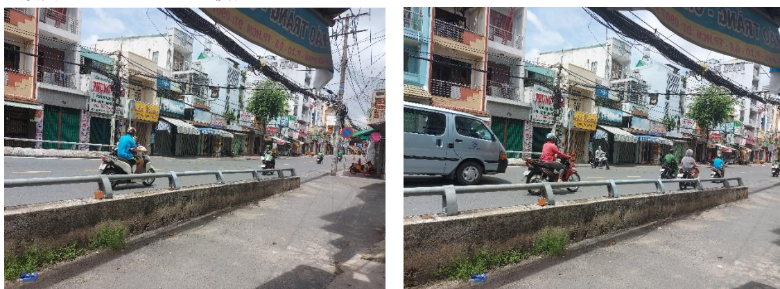
ホーチミンにてロックダウンが実施された2021年7月9日に撮影

Shopee(食材配達)、Tiki(食材配達)、Cooky(食材配達)、AhaMove(運送・配送)などのアプリを通じて、食材を購入し最短2時間以内で配達されている。車は倉庫からスーパーやコンビニなどへのデリバリー、バイクは各宅へのデリバリーを行っているが、配達員も感染を恐れてデリバリーの頻度が少なくなっている模様