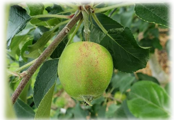
写真 サビ果の様子(東和町)

管内では、4月の凍霜害の影響で、サビ果の発生がみられます(写真)。令和3年の凍霜害被害と比べて発生程度は大きくありませんが、発生が確認される園地においては、 サビ果を優先的に摘果 するようにしましょう。ただし、着果量が少ない樹については、サビ果や側果も着果させるなど、樹勢のバランスを崩さないよう注意しましょう。