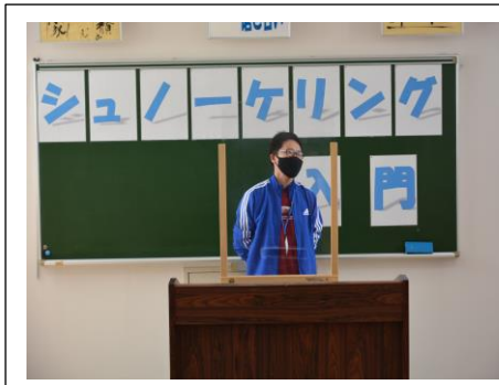
開講式 参加者代表挨拶