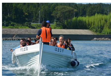
いよいよ、椿島へ。天気は最高！！