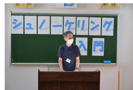
閉講式 参加者代表挨拶