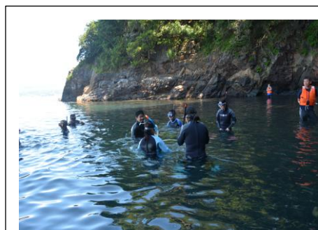
海中散歩。たくさんの海洋生物に出会いました。