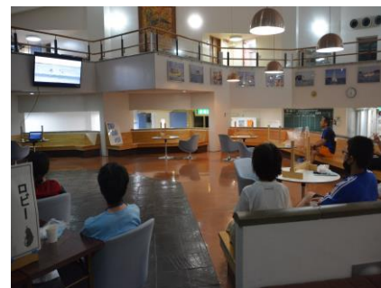
夜はロビーや部屋でリラックスタイム。