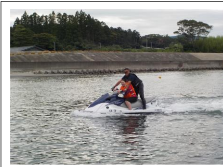
水上バイクやバナボートに乗って海を堪能。