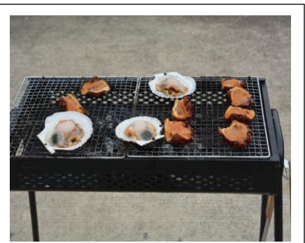
自分で「ほや・ほたて」の殻むきに挑戦！おいしくいただきました。