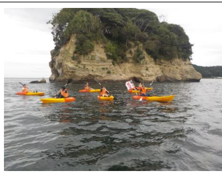
シーカヤックで、志津川湾を満喫！！