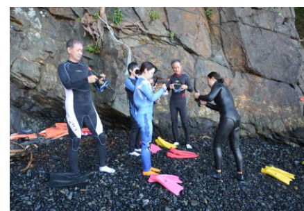
親切・丁寧な講師陣