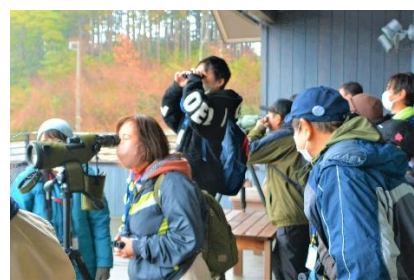
荒天にもかかわらず16種類の野鳥に出会うことができました♪