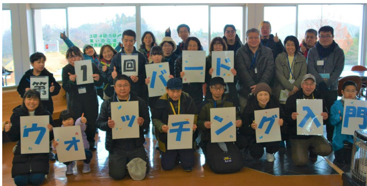
またのお越しをお待ちしております(^^)／