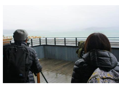
海のビジターセンターのテラスにて野鳥観察