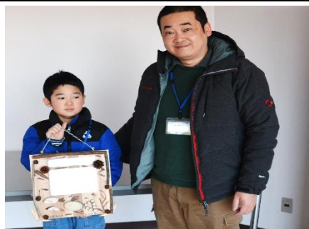
メッセージボード完成