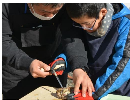
漁業体験（海産物調理）