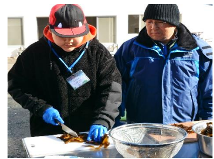
漁業体験（海産物調理）