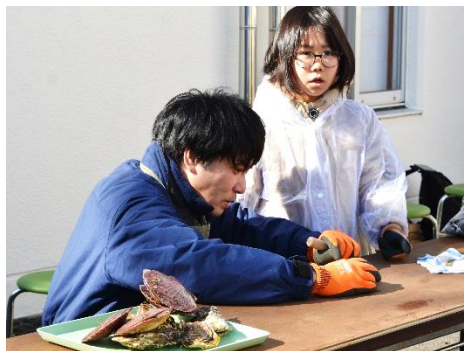
漁業体験（海産物調理）