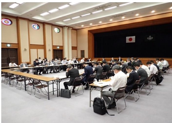
各団体代表者（発言者）：写真中央テーブル