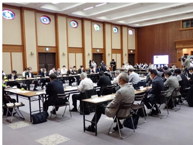
各団体代表者（随行者）：写真外側テーブル