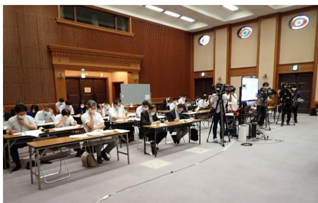
マスコミ・傍聴（県職員）