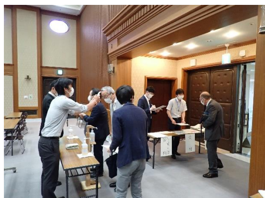
受付・検温・消毒