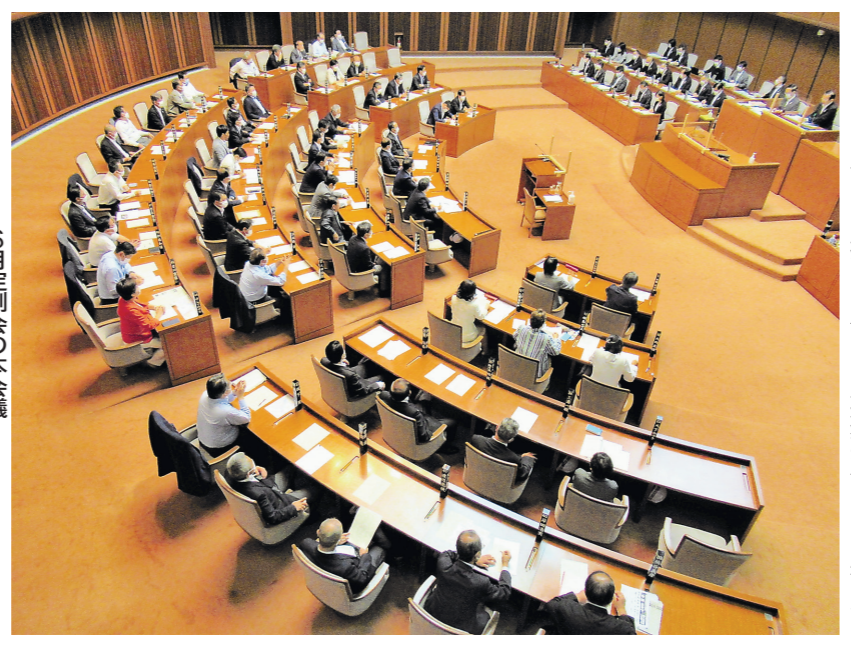
6月定例会の本会議

県が5月に公表した太平洋側の巨大地震で最大級の津波が発生した場合の新たな浸水想定は、活発な議論が展開された。 議員は「津波浸水の公表を受け、沿岸市町は防災計画などの見直しを急いでいる。知事は「速やかな見直しを求める声もあることから、市町の意向を確認しながら改正に向けて取り組んでいく」と述べた。