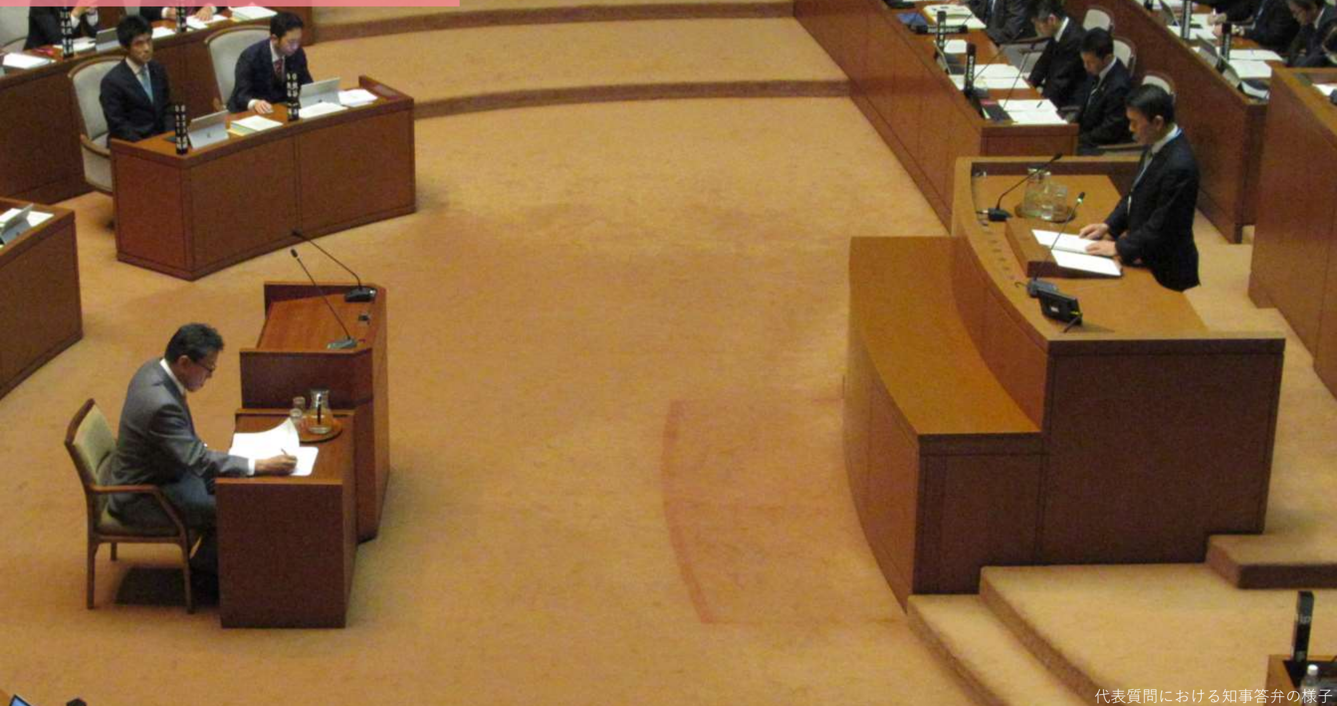
代表質問における知事答弁の様子

自由民主党・県民会議(自民)、みやぎ県民の声(県民の声)、日本共産党宮城県会議員団(共産)、公明党県議団(公明)、立憲・無所属クラブ(立無ク)、21世紀クラブ(21世紀ク)、日本維新の会(維新)