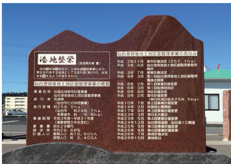
仙台港背後地土地区画整理事業の竣工を記念し、高砂中央公園地内に建立予定の記念碑