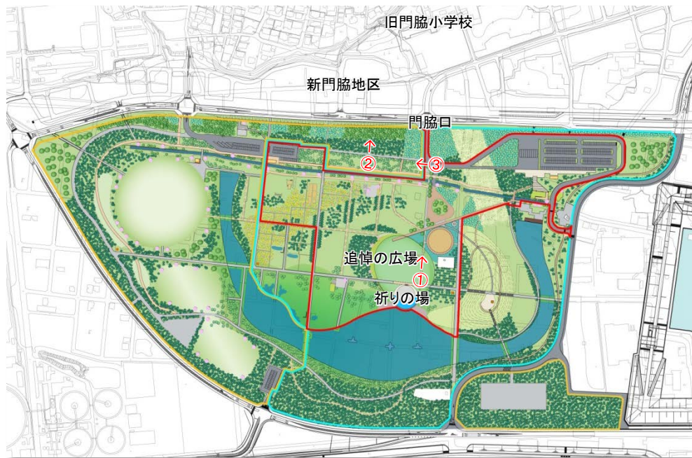
①追悼の広場園路から旧門脇小学校方向