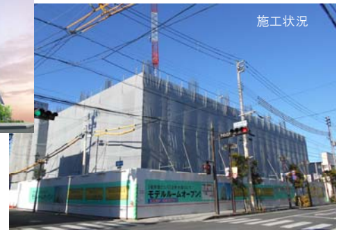
石巻市中心2丁目4番南地区優良建築物等整備事業