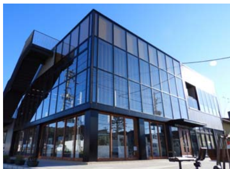
「かわまち交流センター」(通称:かわべい)