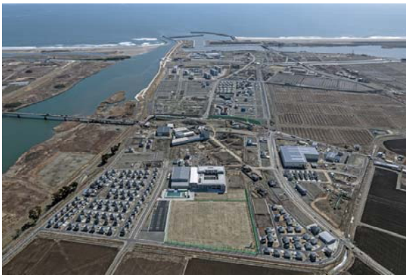
名取市関上地区被災市街地復興土地区画整理事業

平成30年11月30日に、復興庁から復興交付金に係る第22回目の交付可能額が通知されました。復興交付金は県内沿岸部の各市町へ428億円(国費ベース)配分され、このうち国土交通省所管事業は申請額約409億円に対し約408億円(国費ベース、県事業含む)配分されました。今回の配分では、石巻市の下水道事業に大きく配分されたほか、名取市の被災市街地復興土地区画整理事業とそれに関連する事業、石巻市の優良建築物等整備事業などへ配分されています。配分額の大きい事業種別は、「下水道事業」、次いで「道路事業」、「優良建築物等整備事業」となっています。