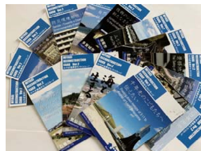
みやぎ復興まちづくりカード第2弾