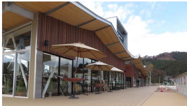
商業施設「迎(ムカエル)」