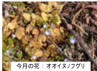
今月の花：オオイヌノフグリ