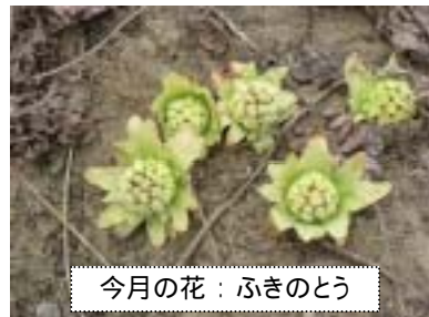
今月の花：ふきのとう

庭先や日当たりのよい場所では水仙が清楚ながら凛とした花を咲かせています。ふと足元に目をやると、いつの間にか、みどりがあざやかに、コバルトブルーやアイボリー、むらさきなどいろいろな色があふれ始め、くりかえす生命の営みの大きさを想う頃になりました。さて、4月を迎え、県庁内では組織改正により、竹の内健康相談関係の担当課がこれまでの「健康対策課」から「疾病・感染症対策室」に移行されました。その他の担当課や窓口はこれまでどおりですので、よろしくお願いいたします。なお、支障除去対策実施計画については、先月環境大臣の同意が得られましたので、今後具体的な作業を順次進めてまいります。