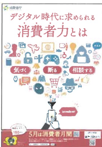
令和6年度消費者月間ポスター

デジタルサービスの仕組みやリスクへの理解、情報に対する批判的思考力、適切に情報を収集・発信する力、これらのアップデートを続けていくとともに、「気づく・断る・相談する」というこれまでも必要とされた基礎的な力も引き続き高めていくことが求められています。