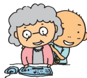
贈与税の課税方式