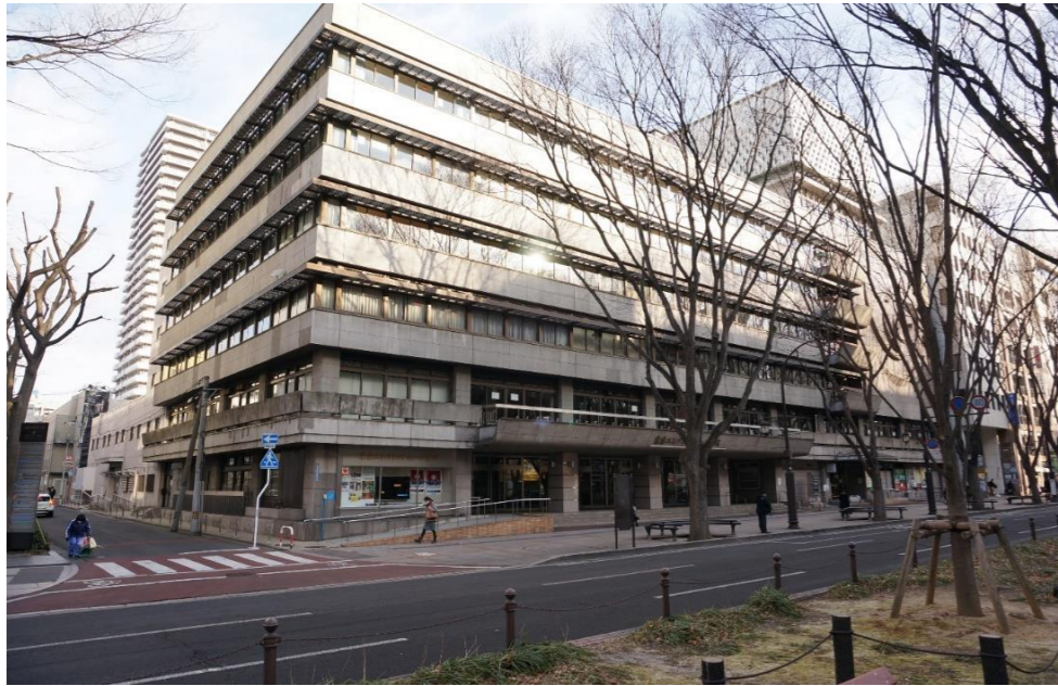
①建物正面（南西側から）