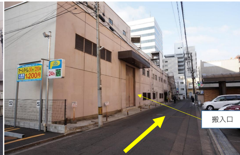
⑤建物裏側（北東側から）