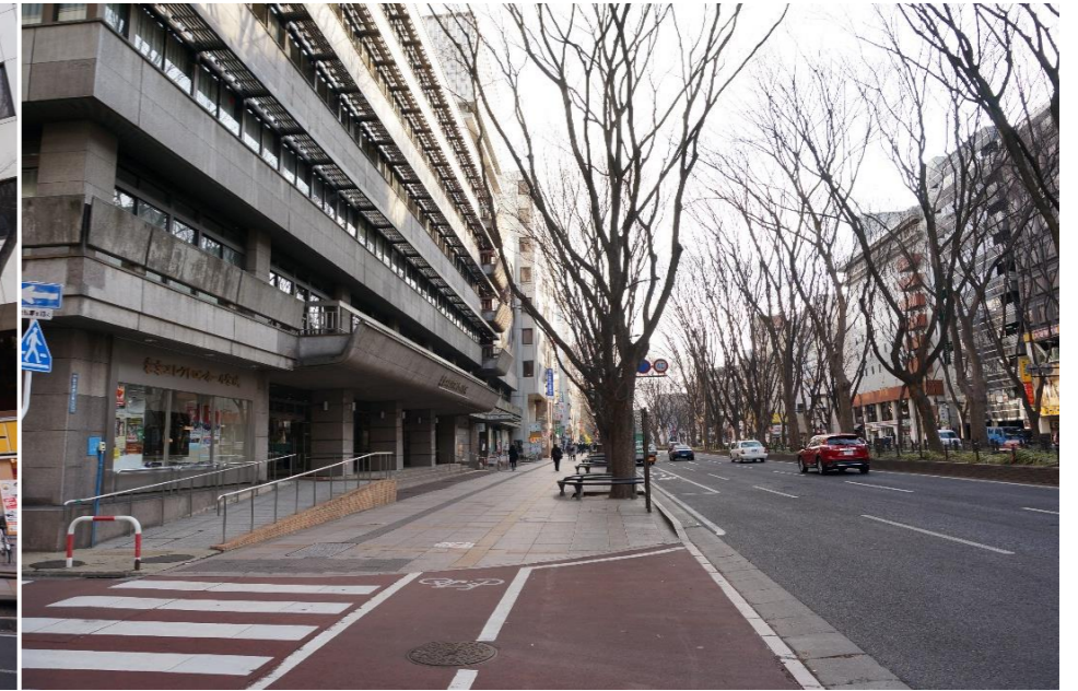
③建物正面と定禅寺通

県民会館（正面側）は、定禅寺通（片側3車線）に面している。市街中心部で交通量が多く、敷地に余裕がない。また、建物東側は商業ビルと隙間なく隣接している。