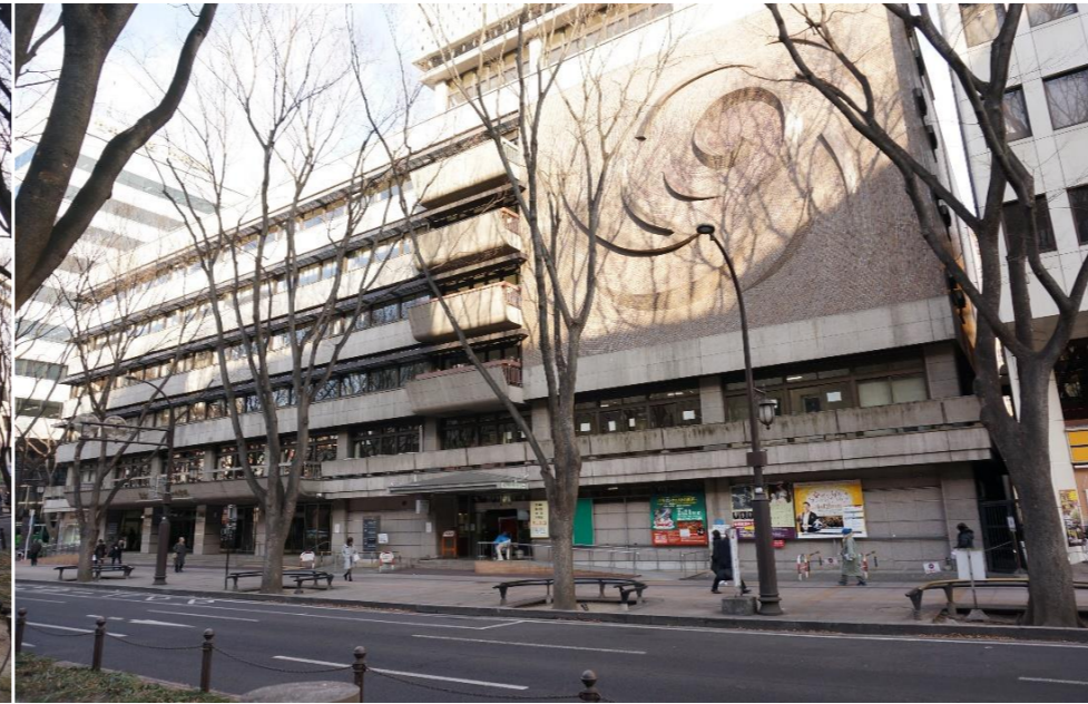
②建物正面（南東側から）