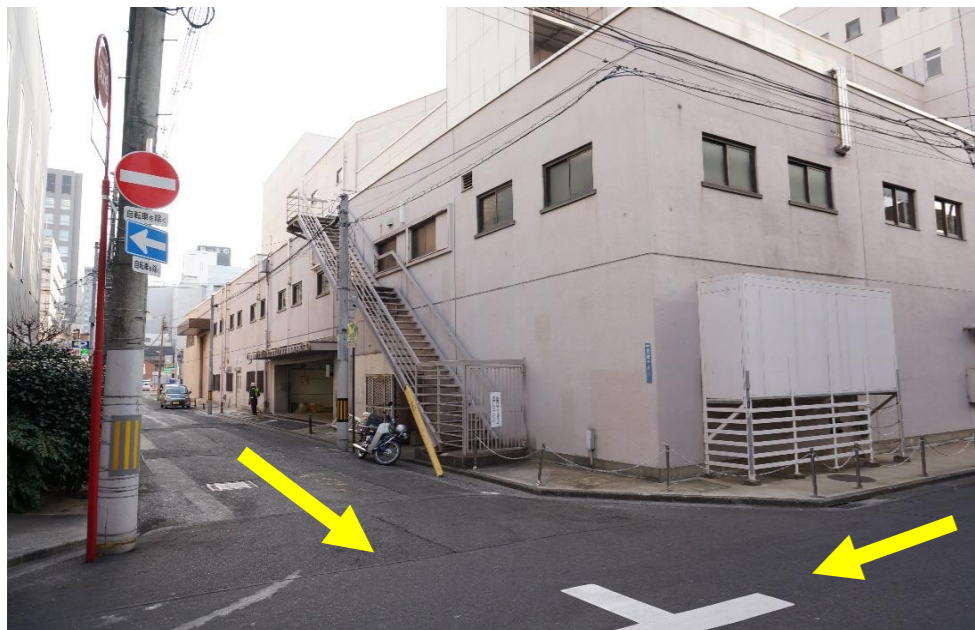
④建物裏側（北西側から）

県民会館（正面側）は、定禅寺通（片側3車線）に面している。市街中心部で交通量が多く、敷地に余裕がない。また、建物東側は商業ビルと隙間なく隣接している。