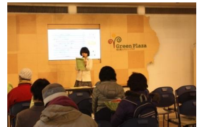
消費生活展での講座の様子

消費生活サポーターになっていただく方には、 認定講座を受講していただきます 。消費生活に関する基礎知識を2日間で学べる内容になっていますので、少しでも消費生活に興味がある方はぜひ受講ください。 受講は無料 です！