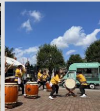
河原町商店街振興組合 マルシェ音市