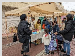
スキルアップ講座 マルシェのボランティア体験