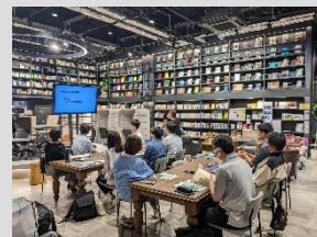
(一社)ながまちマチキチ 市民大学の“ブレ開校”