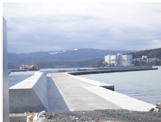
志津川漁港 東防波堤