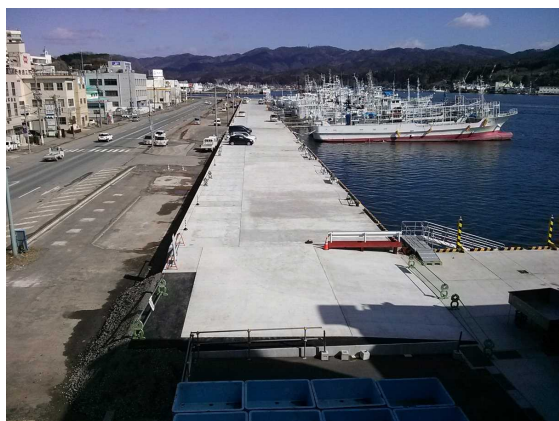
気仙沼漁港 休憩岸壁