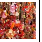
《つるしびなまつり》 毎年4/15～5/5まで 1,000体以上の つるしびなが飾られて います。