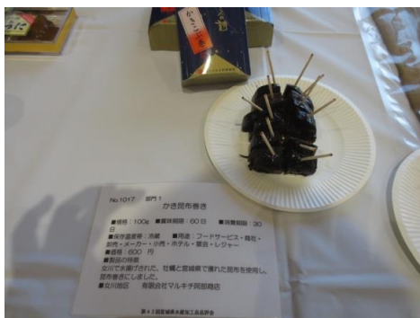
1017 かき昆布巻き 有限会社マルキチ阿部商店