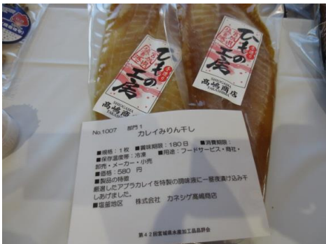
1007 カレイみりん干し 株式会社 カネシゲ高嶋商店