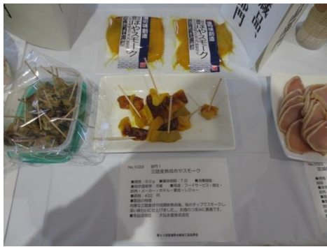
1023 三陸産熟成ホヤスモーク 大弘水産株式会社