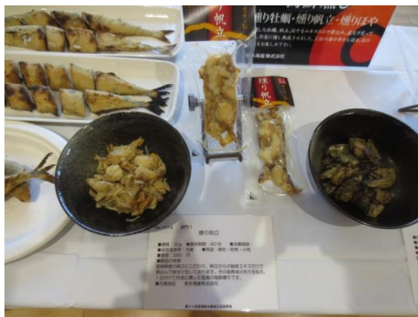
1014 燻り帆立 末永海産株式会社