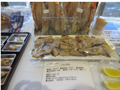
1010 いわし開き 株式会社 丸平かつおぶし