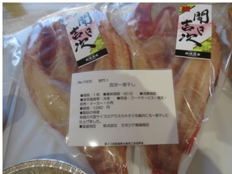
1005 吉次一夜干し 株式会社 カネシゲ高嶋商店