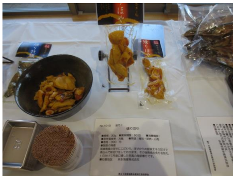
1013 燻りほや 末永海産株式会社