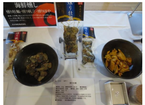
1012 焼り牡蠣 末永海産株式会社