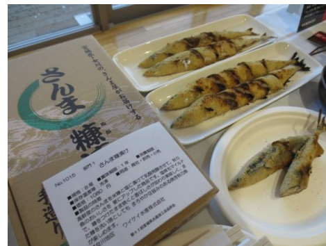
1015 さんま糠漬け ワイケイ水産株式会社