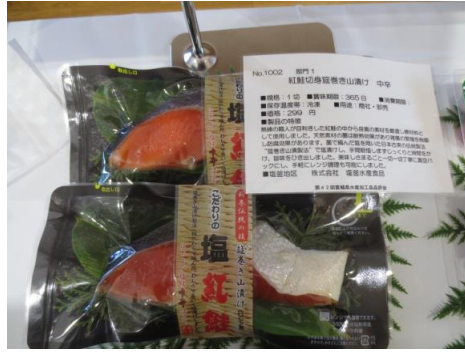
1002 紅鮭切身筵巻き山漬け 中 株式会社 塩釜水産食品