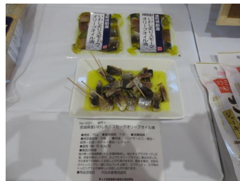
1021 宮城県産いわし炙り スモークオリーブオイル漬 大弘水産株式会社