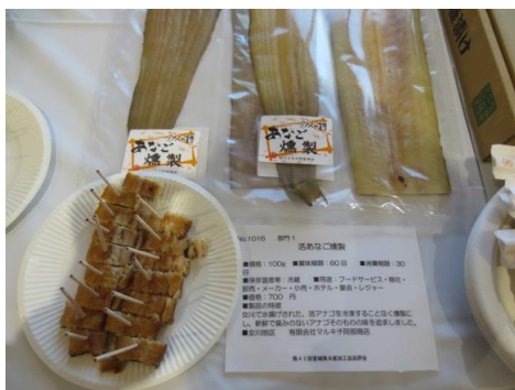
1016 活あなご燻製 有限会社マルキチ阿部商店