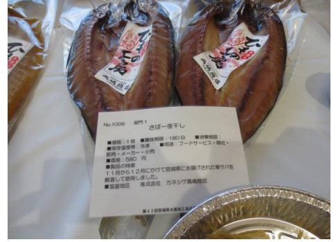
1006 さば一夜干し 株式会社 カネシゲ高嶋商店