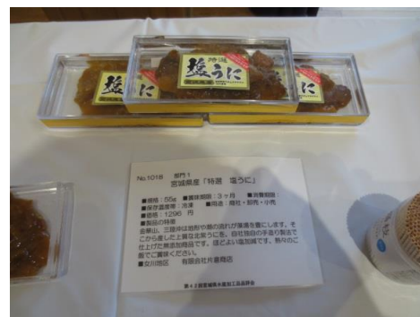
1018 宮城県産「特選 塩うに」 有限会社片倉商店