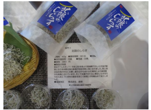
1003 北限のしらす 株式会社 鈴栄