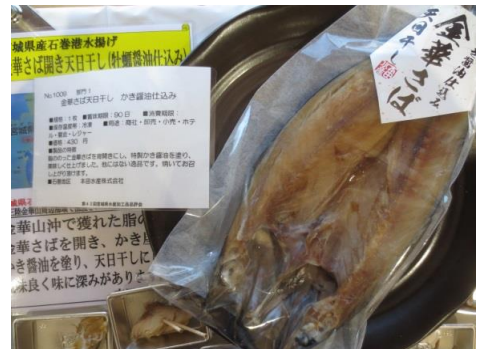
1009 金華さば天日干し かき醤油仕込み 本田水産株式会社