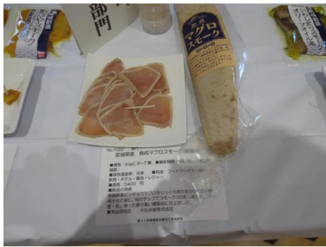
1022 宮城県産熟成マグロスモーク(業務用) 大弘水産株式会社