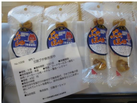
1008 三陸プチ焼きほや 株式会社 三陸オーシャン