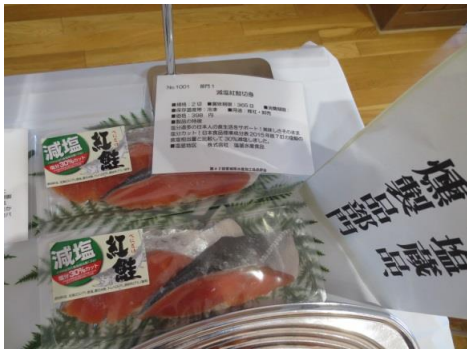
1001 減塩紅鮭切身 株式会社 塩釜水産食品