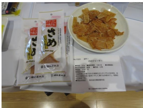
1020 さめジャーキー 株式会社横田屋本店