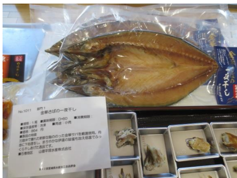
1011 金華さばの一夜干し 山徳平塚水産株式会社