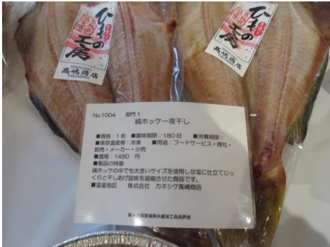
1004 縞ホッケ一夜干し 株式会社 カネシゲ高嶋商店