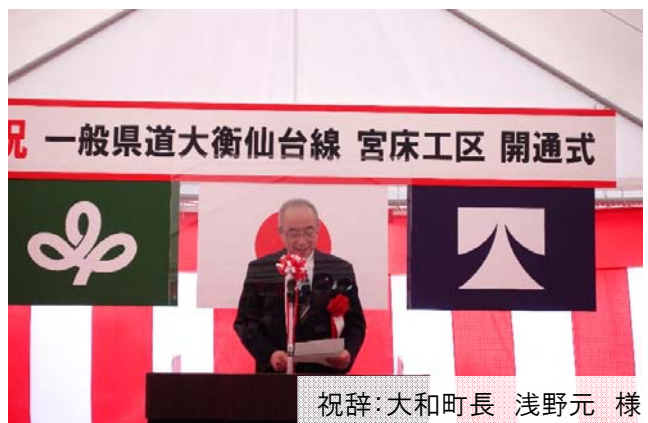
祝辞:大和町長 浅野元 様