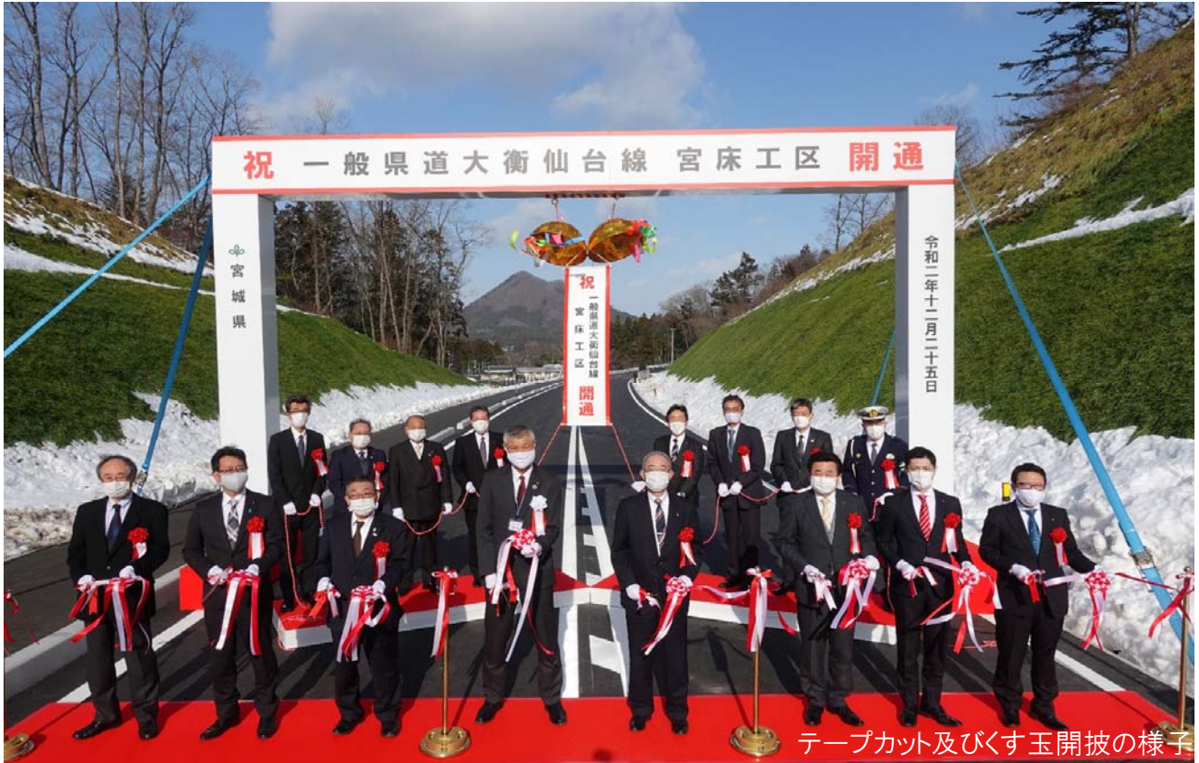
テープカット及びくす玉開披の様子

供用開始に先立ち開通式を開催しました。開通式には、関係市町村の長、県議会議員、地元市町村の議員の他、多数の関係者にご臨席をいただき、テープカット、くす玉開披及び開通パレードを行い、盛大に開通を祝いました。