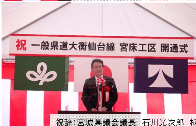
祝辞:宮城県議会議長 石川光次郎 様