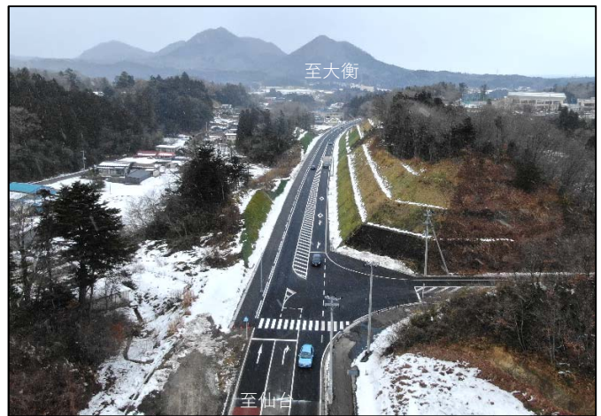
開通後の様子 (午後3時より供用を開始しました)