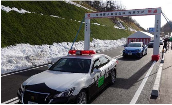
開通パレードの様子