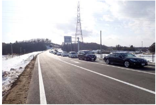
開通パレードの様子