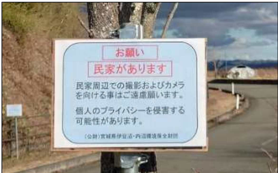
R6.1 シマエナガ撮影者向け注意喚起(財団作成)

なお、使用にあたっては、設置主体の名称や連絡先を記載するとともに、使用した場合は、当協議会で報告いたします。