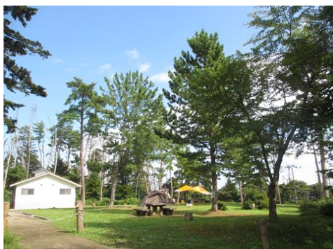
キャンプ場として利用され、人々に安らぎ・休養を与える森林（気仙沼市）