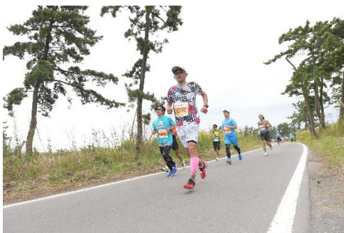
海岸防災林を背景としたイベントを通して地域の賑わいを作り出す森林