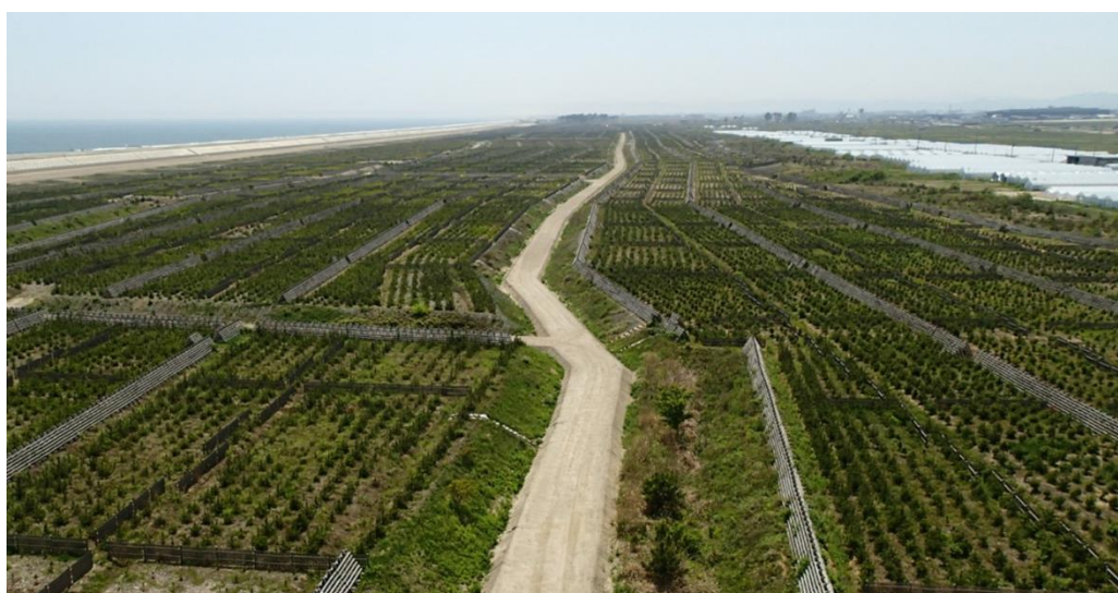
現在の海岸防災林（名取市）

なお、保育方法の技術的指針については、別途「宮城県海岸防災林再生整備指針」で定めることとします。