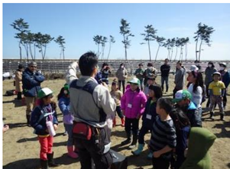
海岸防災林の役割・重要性を伝承する森林