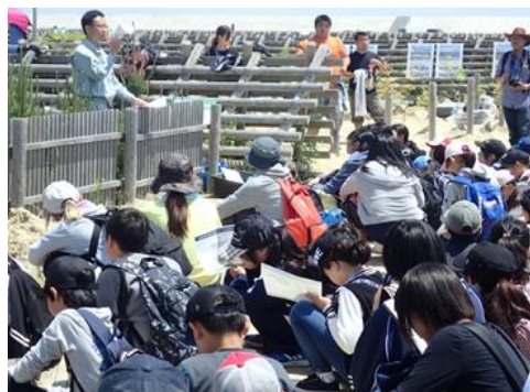
地域の歴史や文化を学ぶ場としての森林