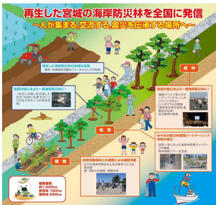
【新みやぎ森林・林業の将来ビジョン（重点プロジェクト5）】

海岸防災林が有する下記の「災害に強い森林」、「地域に愛され大切にされる森林」、「震災を伝承する森林」を目指し、管理を行います。