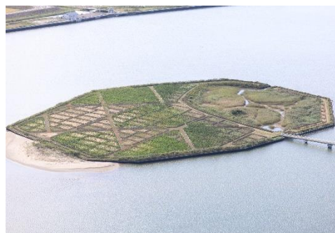
生物多様性の保全が図られる森林（巨理町蛭塚）