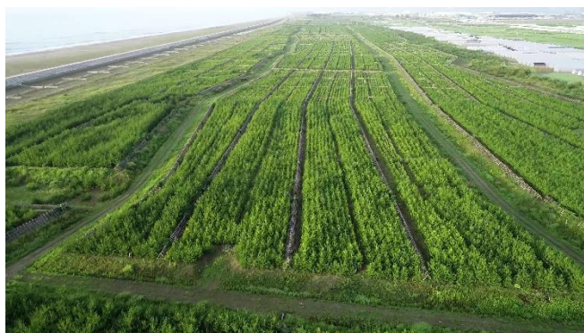
潮害、飛砂、風害の防備や津波被害の軽減効果が期待される保安林（名取市）