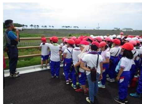
防災教育の場として活用される森林