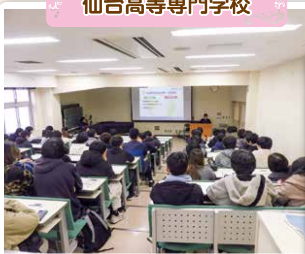
仙台高等専門学校