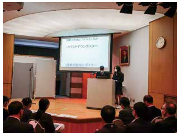
【高校生による活動の様子】