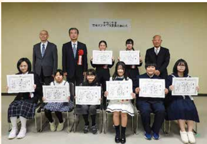
(明るい選挙啓発ポスターコンクール入賞者表彰)