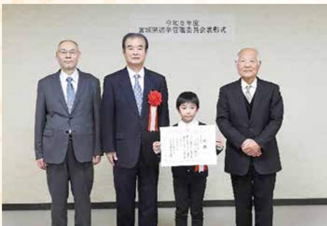
(明るい選挙啓発標語作品最優秀者表彰)