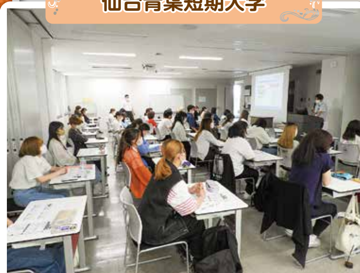
仙台青葉短期大学