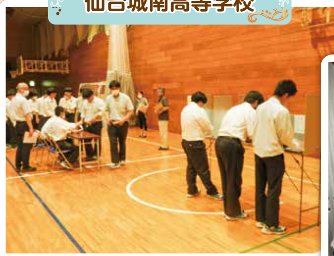
仙台城南高等学校