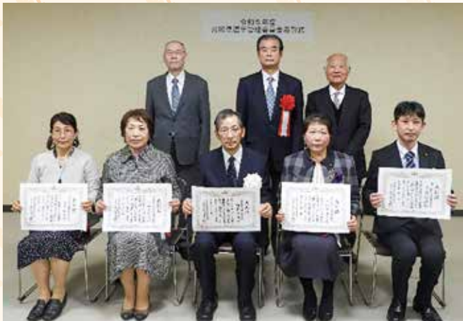
(宮城県選挙管理委員会表彰)

宮城県選挙管理委員会及び宮城県明るい選挙推進協議会は、選挙の適正な管理執行や明るい選挙の推進（ポスターコンクールや啓発標語等）において顕著な功績を収めた方々を称え、令和6年2月10日（土曜日）に宮城県庁において表彰式を執り行いました。