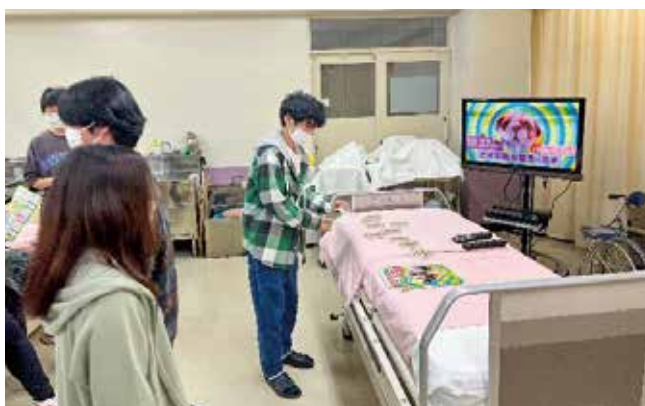
【選挙啓発サポーターによる実施の様子】

県内の選挙啓発サポーターに登録している団体に自発的な啓発活動のサポートとして、啓発物資（ポスター、チラシ、ティッシュ、卓上ポップ）を送付しました。