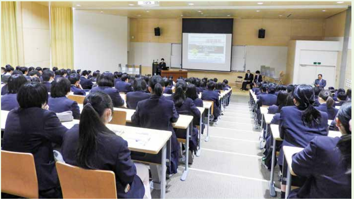
選挙出前講座の様子（宮城県農業高等学校）