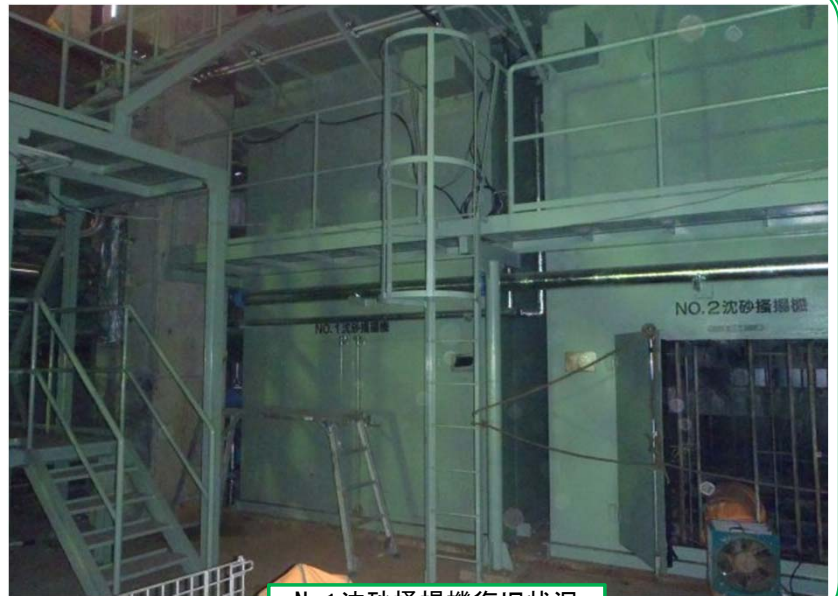
No.1沈砂掻揚機復旧状況

今後は、脱臭設備や建築関係(ポンプ設備・電気室の耐水化、建具等や建築附帯電気・機械設備)の復旧を行ってまいります。