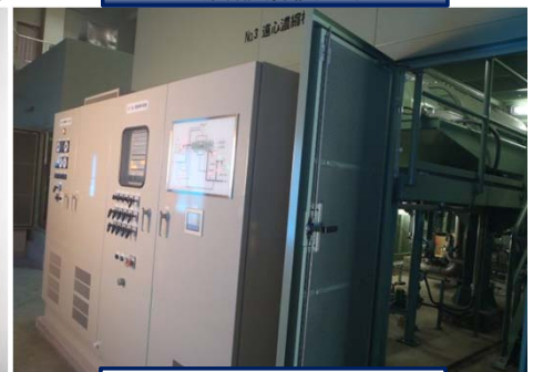
機械濃縮設備復旧状況