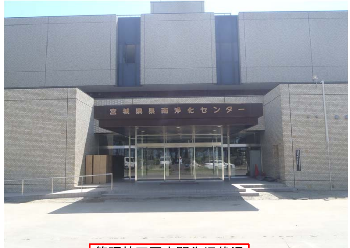
管理棟正面玄関復旧状況