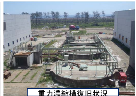
重力濃縮槽復旧状況