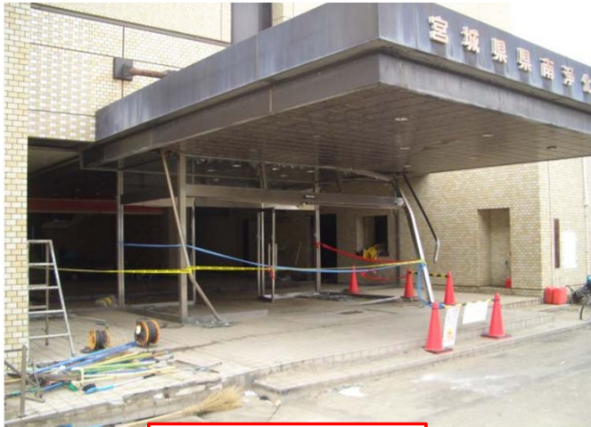
管理棟正面玄関被災状況