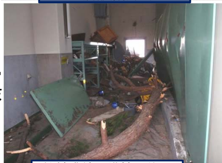
機械濃縮設備被災状況