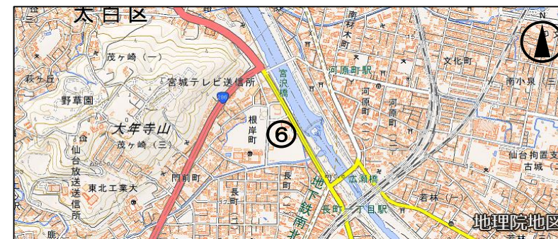
(3) 宮城県第二総合運動場