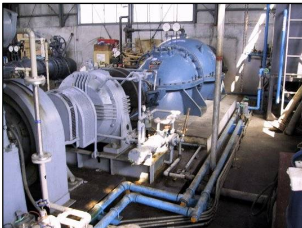
排水ポンプの老朽化が進行しており、機能維持のために適切な措置を講じる必要がある。