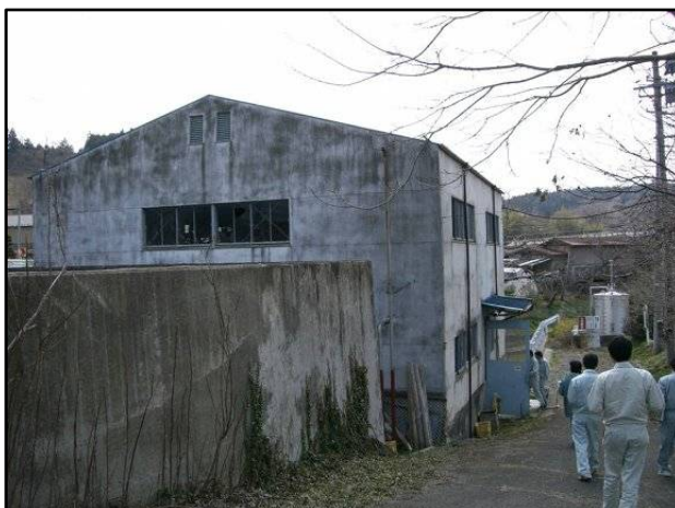
排水機場建屋の老朽化が進行しており、修繕によって排水機場の機能維持を行う必要がある。