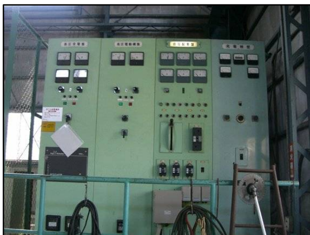
配電盤の老朽化が進行しており、機能維持のために適切な措置を講じる必要がある。