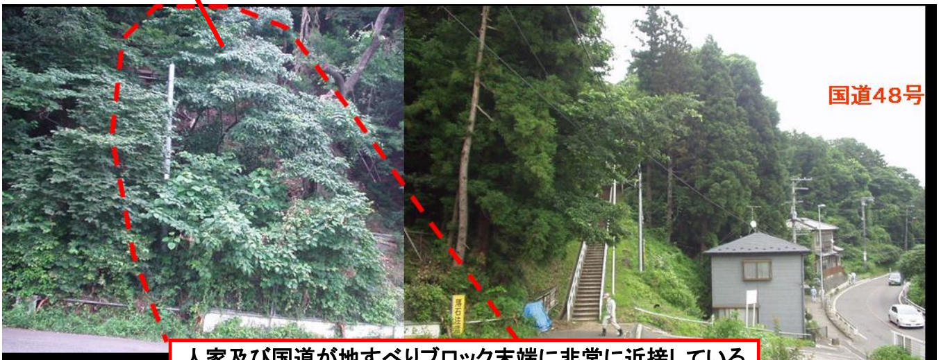
人家及び国道が地すべりブロック末端に非常に近接している