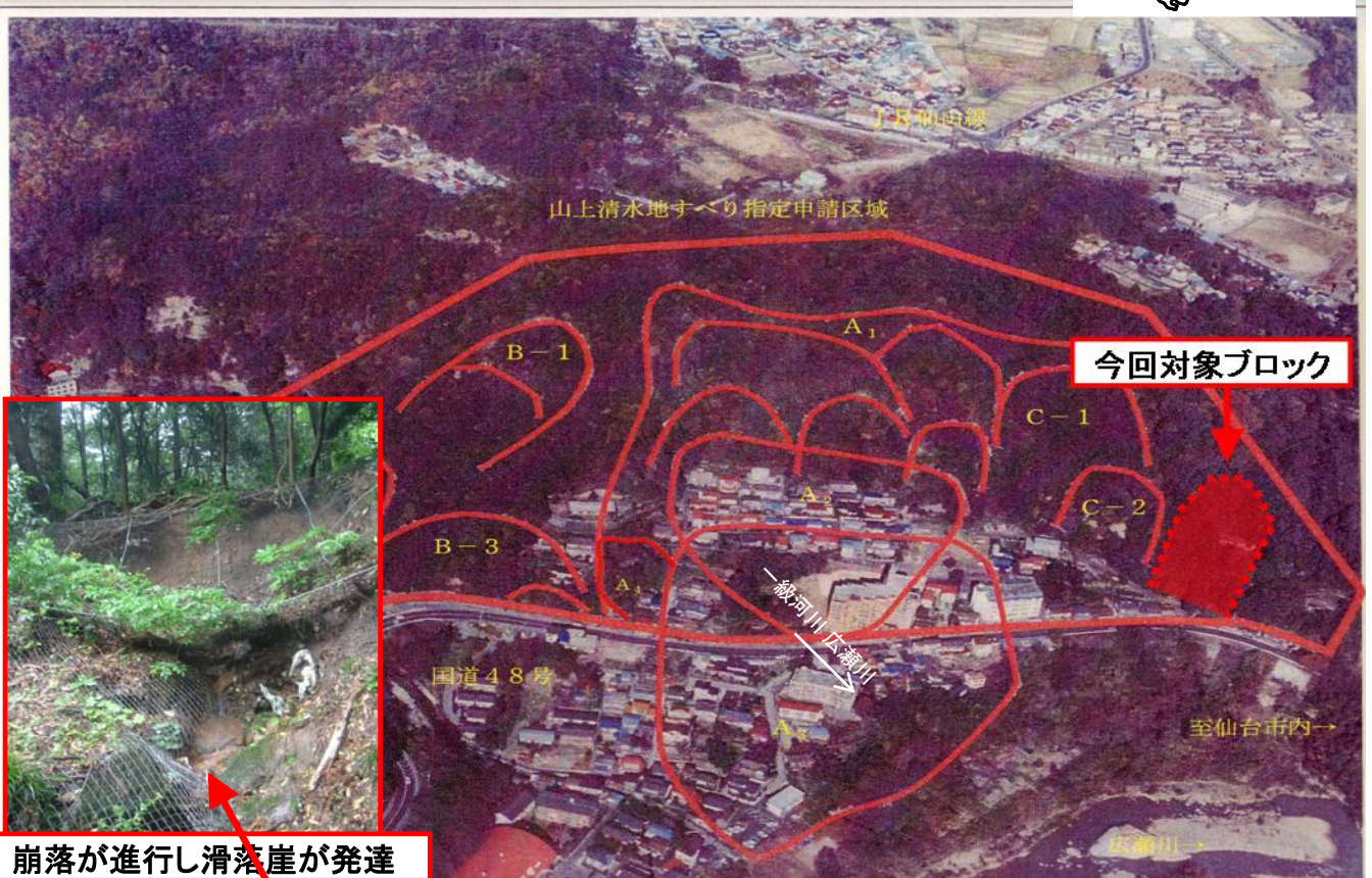
崩落が進行し滑落崖が発達